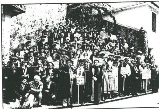
Los participantes en la fiesta anual de la Cofradía del Salmón del Bidasoa.

Tras el oficio se celebraron las entronizaciones. El escenario fue la sala de plenos del ayuntamiento de Vera. El procedimiento para dar entrada a la nuevos cofrades es el siguiente: exposición de los motivos que han merecido el nombramiento y la entrega de sendos medallones y un diploma. Después, la entronización conjunta a golpe de caña tras haber jurado fealdad a esta palabras: «Ante el Capítulo General de esta Cofradía del Salmón del Bidasoa, juramos pública y solemnemente defender en todo tiempo y lugar, cuando así se os lo requiera, a una de las especies más calificadas y admiradas por el hombre, cual es el salmón, y en vuestro caso, al del río Bidasoa».